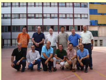
Los miembros de la Comisión en una reunión en el Colegio de La Mina